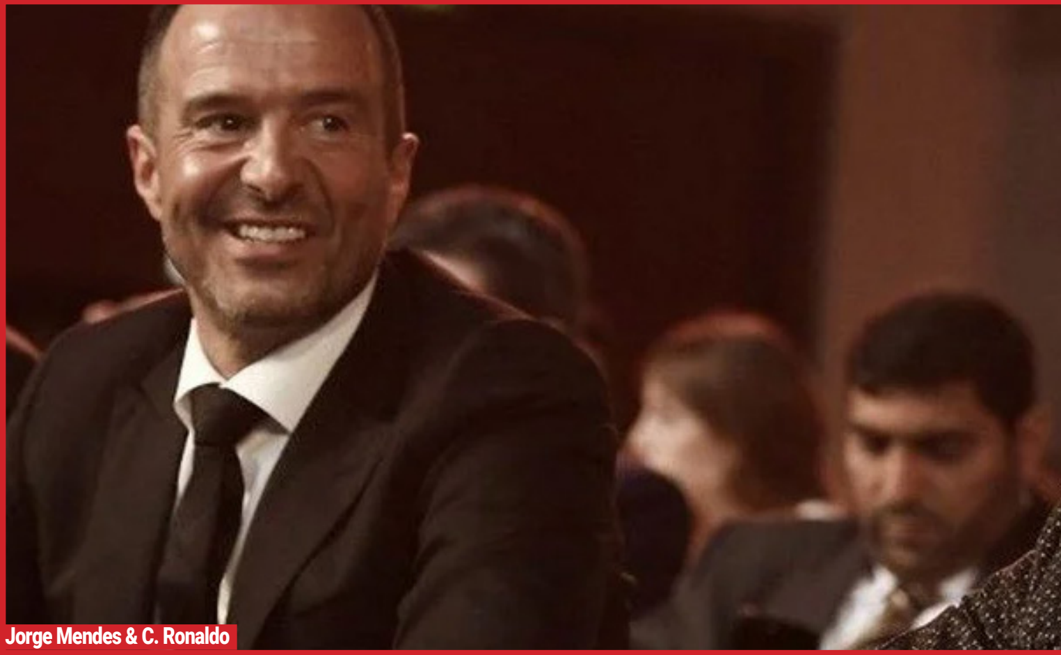
Jorge Mendes & C. Ronaldo